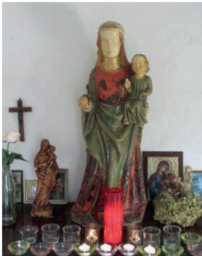
Het mariabeeld, kopie van de Zoete Moeder in de St. Jan

Lange tijd was de naam van de opdrachtgever voor de bouw van de kapel