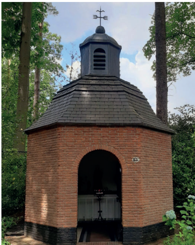
De kapel, een ontwerp van architect Jos. Bedaux.

Enigszins verscholen aan de Delmerweg in Tilburg ligt een Mariakapel. 'Maria oorzaak onzer blijdschap' luidt de officiële naam.