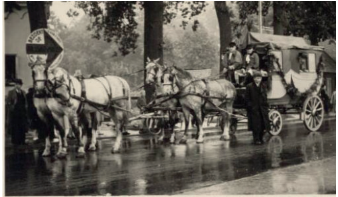
In 1948 vond in Tilburg een historische optocht plaats. De intocht in 1841 van Koning Willem II en de rijtoer in de Gouden Koets werden nagespeeld.

ook als koning grote belangstelling voor onze stad toonde en haar ontwikkeling sterk heeft beïnvloed, de hoofdpersoon. Koning Willem II wordt om half drie afgehaald aan de Bredaseweg voorbij de spoorwegovergang ter plaatse, waar voorheen "De Vier Winden" stond. Om drie uur begint aan het Villapark bij de Bredascheweg de Historische Op-