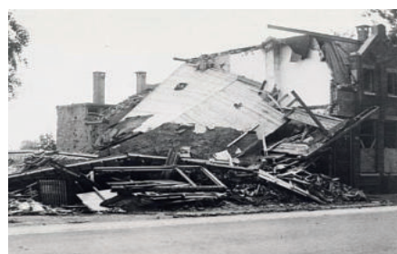
Links: Café De Vier Winden op de hoek van de aan de Bredaseweg en de huidige Vierwindenlaan. Rechtsboven: daar staat nu villa 't Ankertje. Rechtsonder: de restanten van café De Vier Winden na het bombardement.