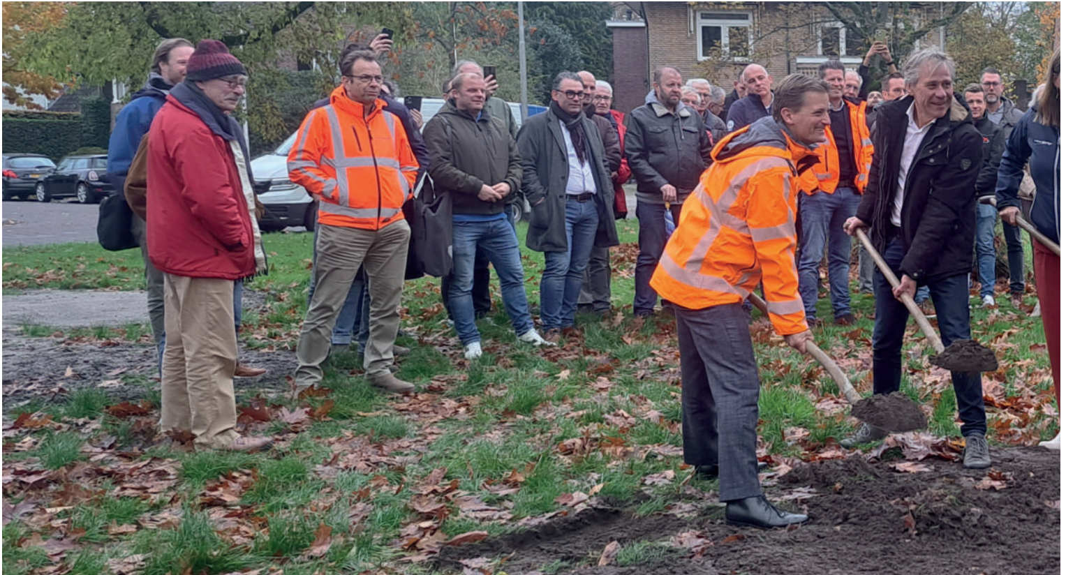
Met het planten van een boom en het heffen van een glas in de kapel van Mariëngaarde werd de herinrichting van de Burgemeestersbuurt op vrijdag 11 november feestelijk afgesloten.