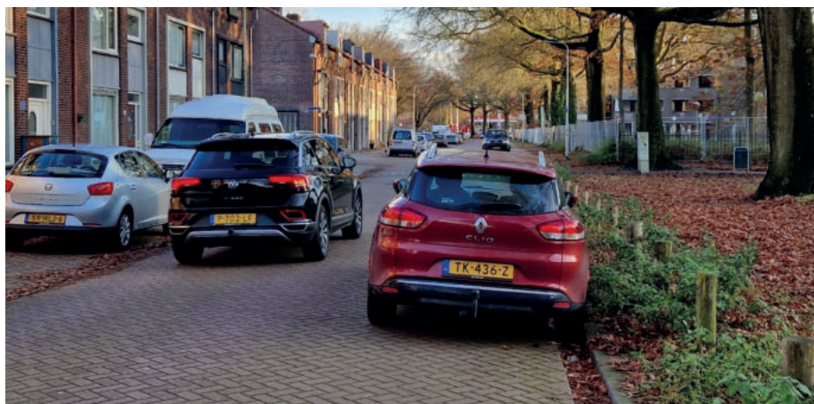
Gevaarlijke situaties en grote kans op een bon in de Van Limburg Stirumlaan.