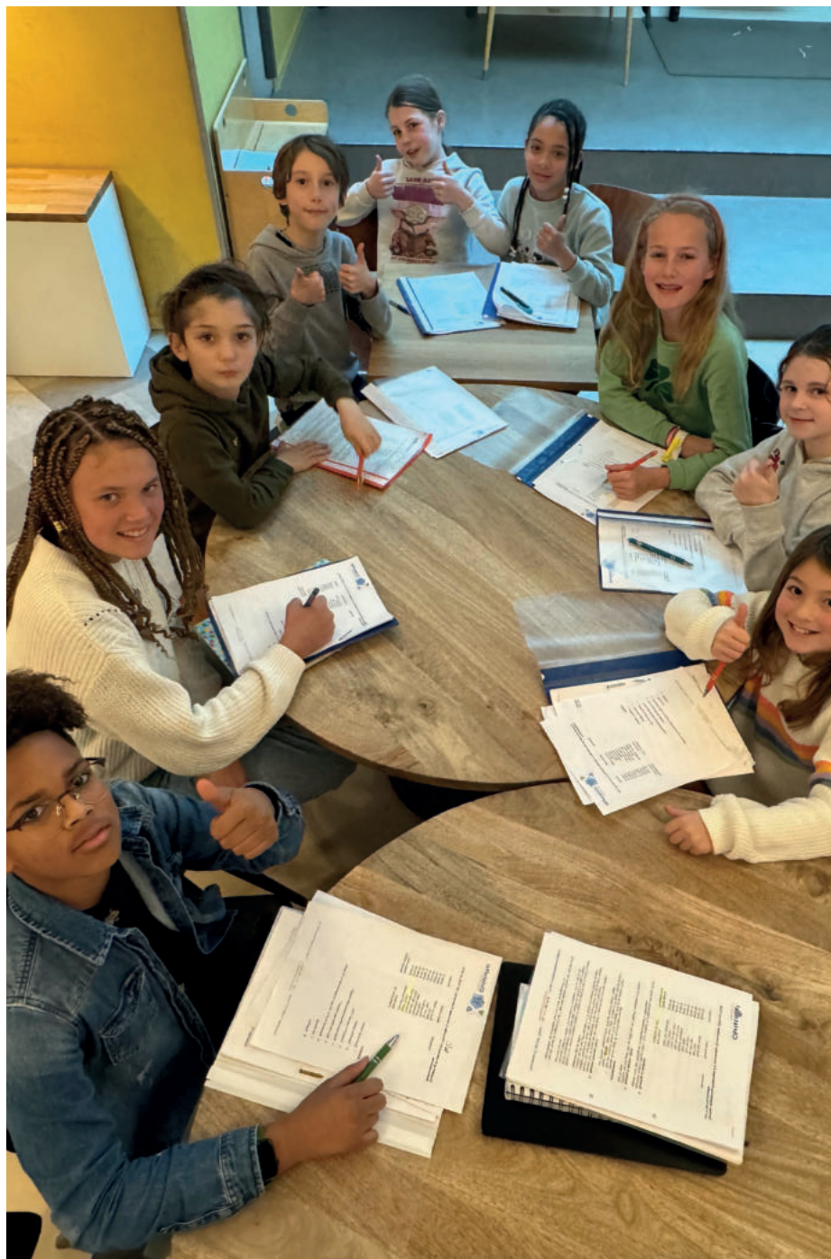
De Kinderraad van Kindcentrum Christoffel kroop op 15 januari weer rond de tafel voor een vergadering. Op de agenda stond onder andere papierafval op de toiletten en half opgegeten fruit.

Ieder schooljaar komen alle Tilburgse kinderraden bij elkaar. Dit jaar was basisschool Don Sarto op 31 januari de ontvangende school. Hiervoor kregen alle kinderraden de opdracht om een filmpje te maken van maximaal twee minuten over de gevaren van sociale media en tips hoe je hier mee om kunt gaan. Twee kinderen van de kinderraad presenteerden het filmpje aan kinderen in de groepen 5 tot en met 8 en gaven hierbij een presentatie over sociale media. De kinderraad van Christoffel is druk bezig geweest met dit filmpje. Het gaat over de gevaren van sociale media, zoals nepnieuws, gevaarlijke challenges,