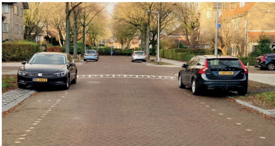
Veilige straten en volop parkeermogelijkheden na de herinrichting van de Burgemeestersbuurt.