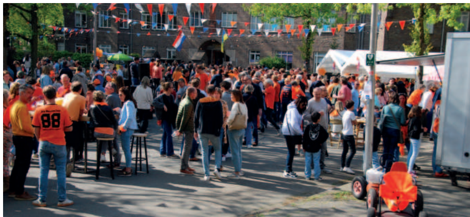
Gezellig druk op en rond de rotonde bij Mariëngaarde.

Twee jaar geleden keken de Oekraïners die tijdelijk in Zorgvlied wonen hun ogen uit. Ook in 2023 waren zij uitgenodigd. „Ouders en kinderen waren heel enthousiast. Vorige jaren hebben we de Oekraïners als eregasten getraceerd. Inmiddels