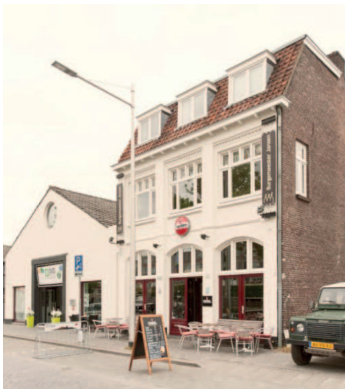
Café Burgemeester Jansen aan de Piushaven.

Als je zoals ondergetekende al meer dan veertig jaren in de Burgemeester Jansenstraat woonachtig bent, wordt het wel eens tijd iets meer te weten te komen over die burgemeester. Daarom ben ik op zoek gegaan.